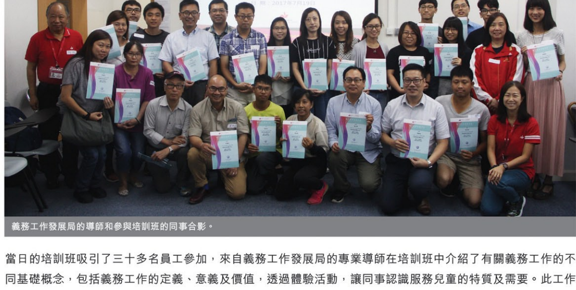
義務工作發展局的導師和參與培訓班的同事合影。

新福港於7月19日舉辦了義務工作基礎及技巧培訓班，邀請到義務工作發展局提供培訓，內容包括服務兒童時的技巧，倡導對社會作出貢獻。新福港的義務隊並於當天下午參與了一個有意義的演講和一連串啟發性的遊戲。