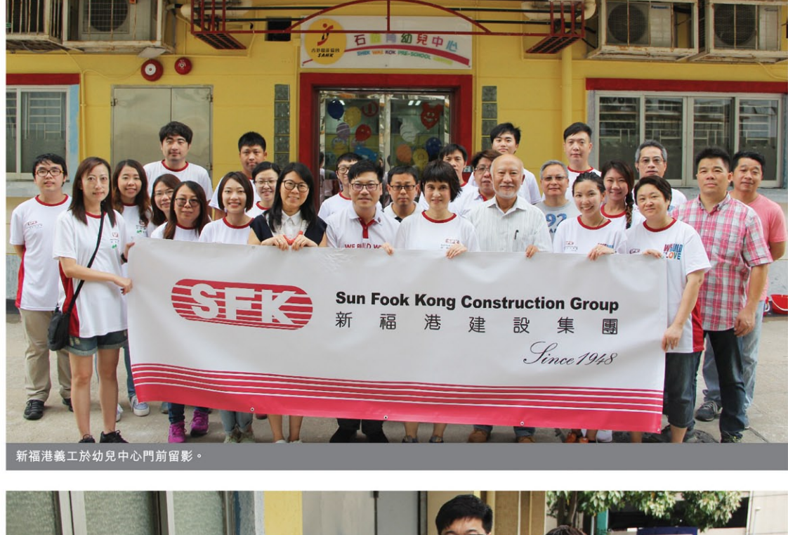
新福港義工於幼兒中心門前留影。

新福港於6月3日舉辦了一個名為「油」心出發 - 幼兒中心油漆翻新活動，新福港義工隊積極參與，透過為社區的幼兒中心重新翻上油漆，令外牆煥然一新，共同渡過了一個有意義的早上。