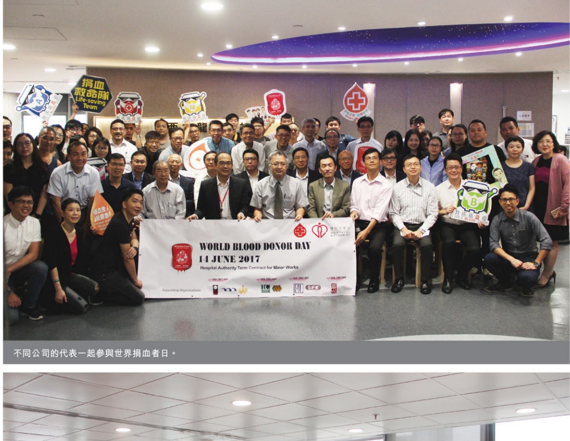
不同公司的代表一起參與世界捐血者日。

一年一度的世界捐血者日於6月14日舉行，新福港繼續通過鼓勵和組織員工參與捐血活動。