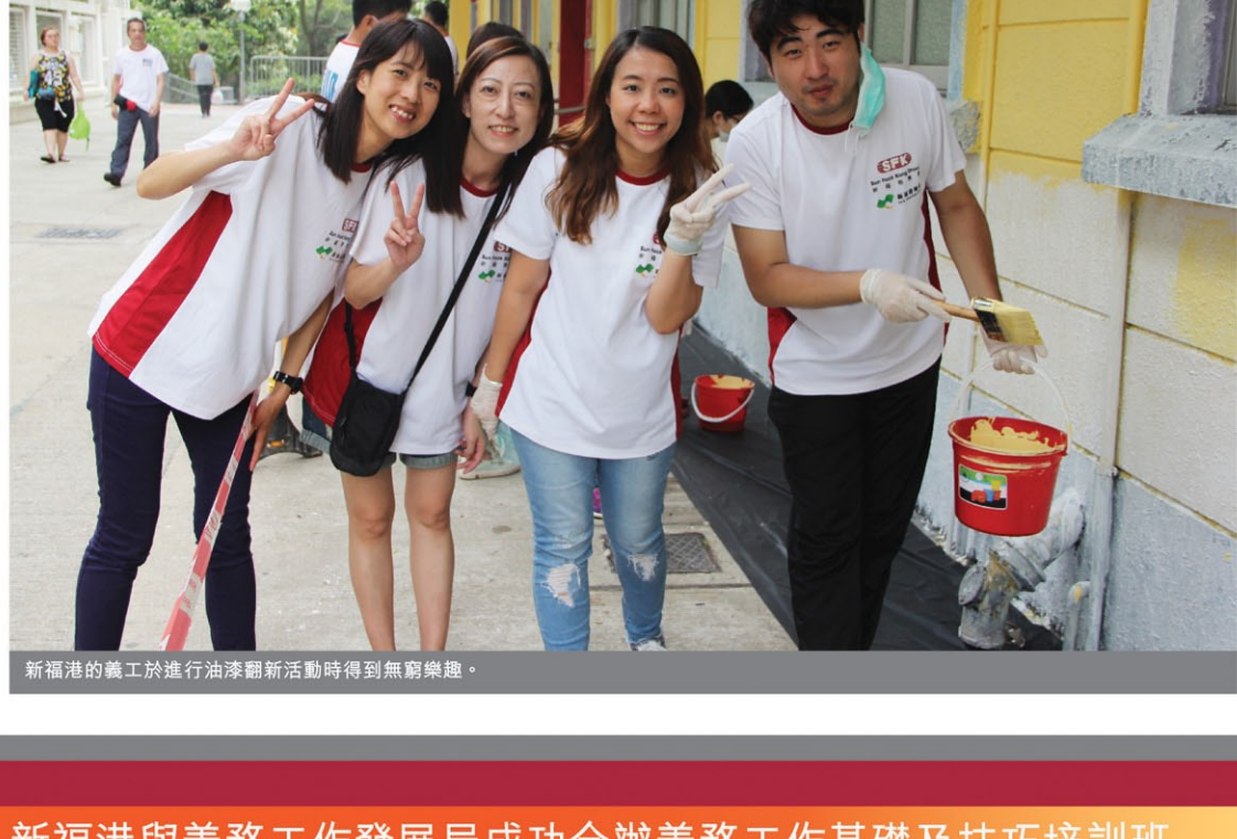
新福港的義工於進行油漆翻新活動時得到無窮樂趣。