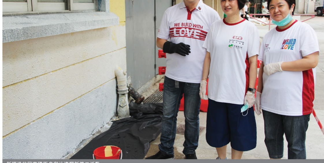
新福港的同事積極參與油漆翻新義工活動。

新福港義工隊繼續為社區作出貢獻，當日油漆翻新活動有二十多名義工，這個「油」心出發活動為新福港義工隊隊員提供了回饋社會的機會，為幼兒中心描繪了豐富多彩的空間。